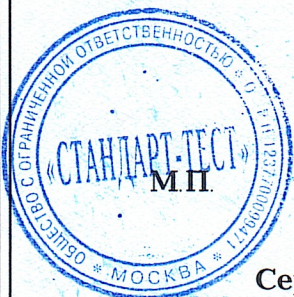
Схема сертификации: 1с.